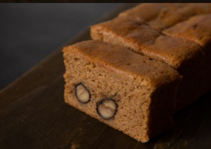
ケイク・マロン cake aux marrons